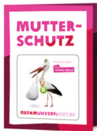
Sichere Geburt 25€